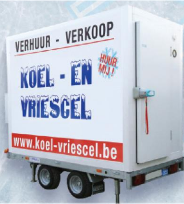
KOEL - EN VRIESGEL 7,5 M 3 DUBBELE AS