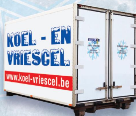
KOELCONTAINER 16 M 3

DÉ OPLOSSING VOOR UW RECEPTIES, BARBECUES, EETFESTIJNEN, ... WIJ LEVEREN OOK AAN HUIS!