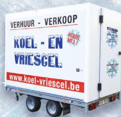
KOELCEL 7,5 M 3 DUBBELE AS