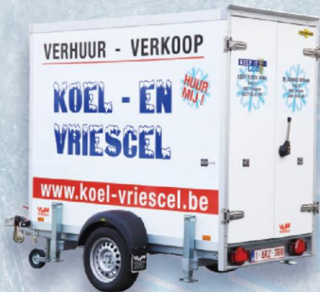
KOELCEL 6,5 M 3 ENKELE AS