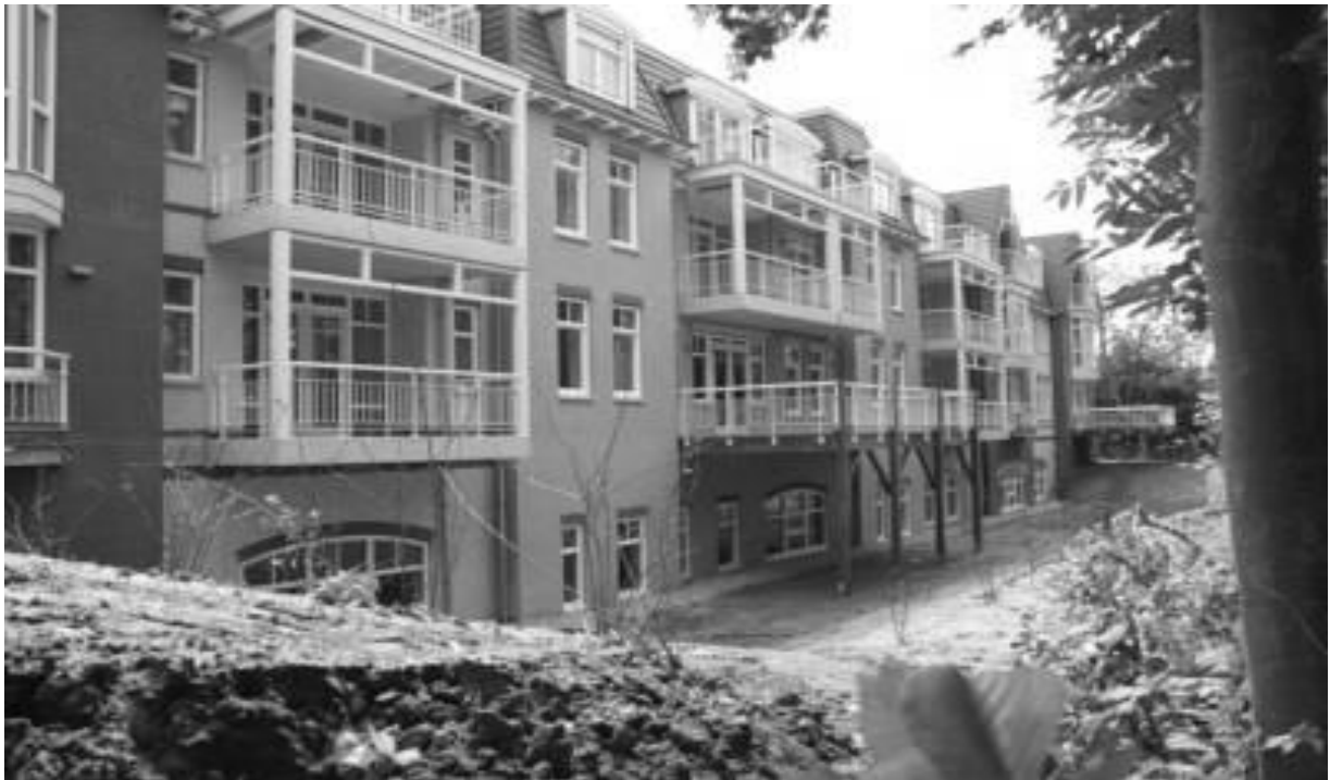
Een beeld van verblijfhotel Ter Duin in Burgh - Haamstede